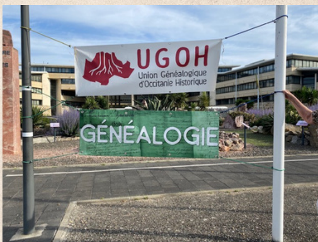
Hôtel du département de l'Aude

Le colloque régional de généalogie s'est déroulé dans une ambiance studieuse, réunissant un public très engagé. Les participants ont salué la qualité des interventions et la richesse des échanges tout au long de la journée.