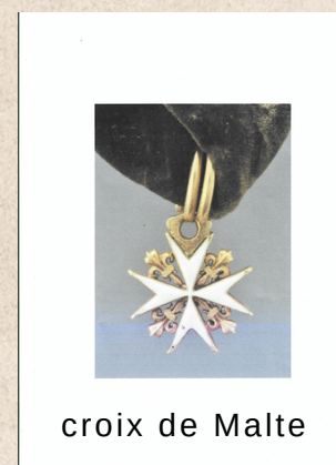
croix de Malte

La croix de Malte était celle des chevaliers de Saint-Jean de Jérusalem (ou Hospitaliers), installés dans le Gard au Grand Prieuré de Saint-Gilles, puis transférés à Arles en 1562. Liée au prestige de l'Ordre de Malte, cette croix influença fortement la création des bijoux féminins de l'époque.