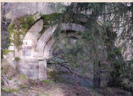
Portail de l'ancienne église, prieuré bénédictin simple, de St Clément (Pradelles-43-)